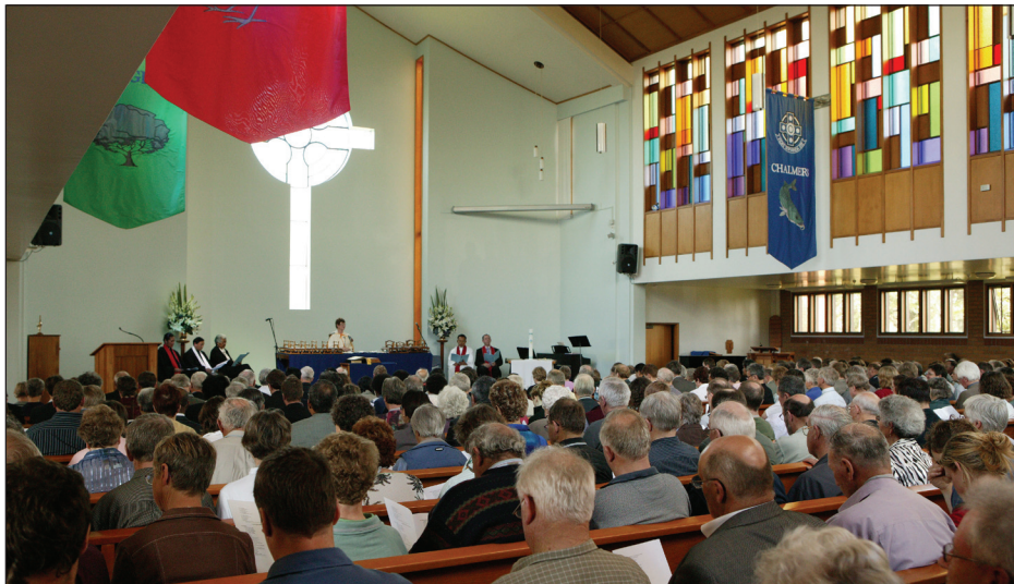
O le sauniga i le tatalaina o le Fono Tele 2006

O lenei tama'itusi e tali ai fesili e uiga i ala tupemaua a le Fono Tele ma le Faaaogāina, e aofia ai le auililiga o auunaga eseese o loo faia e le Ofisa o le Fono. Lomiga Fepuari 2008