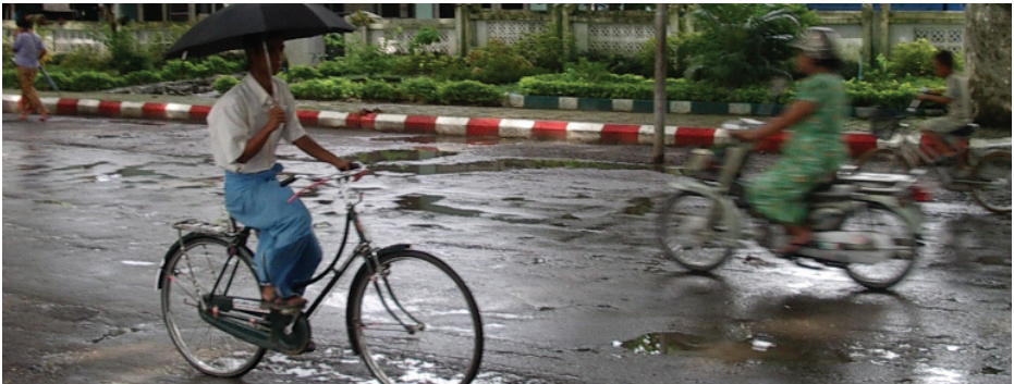
O se vaauga i magaala i Mianama, lea ua avea ose vaauga e taula'i iai galuega tala'i a le Ofisa o Misiona i l2 2007 male 2008

tupe faasoasoina a le Fono, ta'ita'i le vaiga o faaunegatupe ma tiposi a faifeau ma aulotu, ma tuuina atu ala o fesootaiga mo inisiua a aulotu, pepa utu penisini o taavale a faifeau ma mataupu i Faaputugatupe mo tagata e faasino iai. Ua silafia e le FSD tulaga faigata ma le tele o galuega a teutupe o aulotu ini nai tausaga ua mavae atu, ma ofoina ai fautuaga tautupe, galuega ma lafoga i aulotu, atoa ai ma le saunia ose tusi fou mo Teutupe, o le a faamatuu atu i le amataga o le 2008. E faaopopo atu iai, faatonu tautupe ua ofoina mo vaega o le Ekalesia e pei o le Fono o Tagata Asia ma le Sinoti a Tagata Atumotu o le Pasefika.