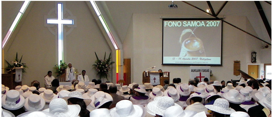
Fono Samoa 2007 sa faia i le PIPC Niutone i Ueligitone

faaletulafono ma tupe maua ma tulafono a le Ekalesia e pei ona faatulagaina i le Tusi Tulafono a le Ekalesia ( Book of Order) . O le aso sa amata tuufaatasi ai mai 1847 ma e aofia ai le 550 pepa tusia a tagata taitoatasi mai faifeau, tiakono tamaitai , misionare ma tagata failauga talafeauga, e faapea foi ma le tuufaatasia o le 80,500 o atapu'e ma le 2000 lipine o leo/ata tifaga. O le Ofisa teu faila o loo faatupeina faatasi e tupe fuafuaina a le Fono Tele ma le Sinoti a Otago ma Southland. O le faatupeina o isi galuega faaopopo o loo tausaili mai tupe talosaga faameaalofa mai isi faalapopotoga ma teugatupe faapitua (Trusts).