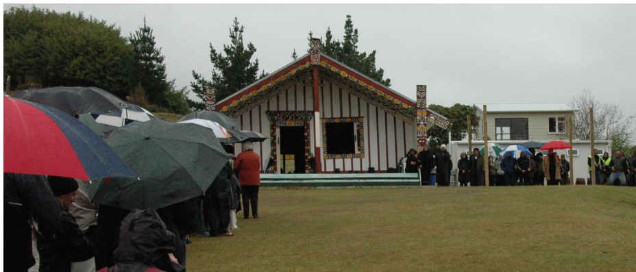
Tauaofia Ta'ita'i i le toe tauaaina atu o le fanua i Maungapohatu i o latou tagata ia Aukuso 2007

Fesootaiga (4 pasene) e tapena ai la tatou tusi o le Spanz , fesootaiga ma faifeau i imeli e ala i le Bush Telegraph, tusitusiga a faifeau Candour, ma le vaai lelei ole upega tafailagi a le Ekalesia www.presbyterian.org.nz . I tausaga na sei mavae atu nei, o le faatupe a le CWM sa faaaoga e faatamo'e ai a'oga i feagaiga ma ala faasalalau ma le polokalame "Standing Out in Your Community". I le 2006, sa amata ai e le vaega o Fesootaiga le faiga o mataupu lautele i tamaoiga ta'i kuata ma mamamu le nusipepa a le Ofisa o Misiona, Global Mission Gazette . O loo feagai foi i tatou ma le Fauautua i talafou o le Fono ma isi tusi i totonu o le ofisa, e faapea foi le tuuina atu o fautuaga i ala faasalalau i le Ta'ita'i, AES ma aulotu, ma pulea tali o fesili i ala faasalalau.