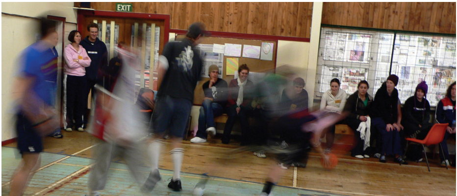
Tagata pasiketipolo o loo taalo i taaloga o le PYM Fesoota’i07

O le National Mission Enabler (4 pasene) e saili ia mafai e le Ekalesia ona fausia se siosiomaga o le amataga o misiona fou ma toe faafou ia mafai ona tupuolaola ma iai se taunuuga. I le sootaga o tagata vaai ma ekalesia autū ma peripereane ia faafaigofie le faagasologa o le misiona, ma saili alamanuia e ala i suesuega faaneionapo ma faamatalaga, e sui ai le vaai i le misiona. O nisi o faatupeina e ala mai le Presbyterian Foundation, PSDS, le Sinoti a Otago ma Southland, ma le Komiti Aoa Fono Tele mo Misiona o le Lalolagi, faapea foi ona tualala mai nuu ma itumalō. O Misiona a le Atunuu e aofia ai Kids Friendly, galuega taulāmua o le ekalesia e pei o le Student Soul ma